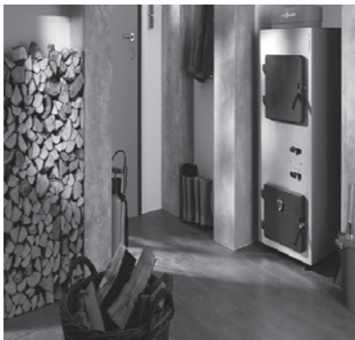
■ Ekologický kotel. Ilustrační snímek